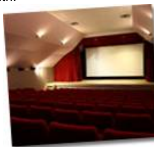
Il nostro cinema